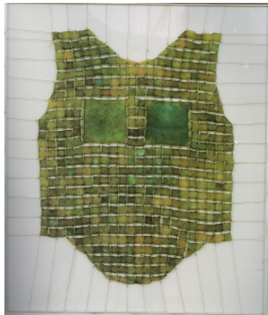
Modell für einen Hautharnisch