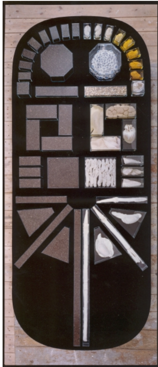
Park für den letztlich Liegenden